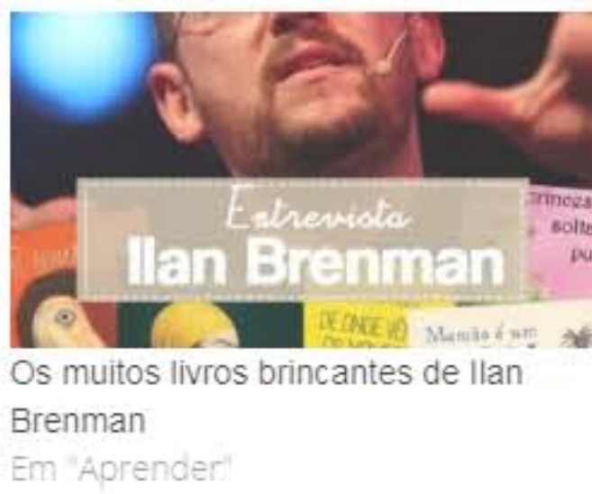
Os muitos livros brincantes de Ilan Brenman Em "Aprender"