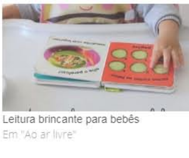
Leitura brincante para beb s Em "Ao ar livre"